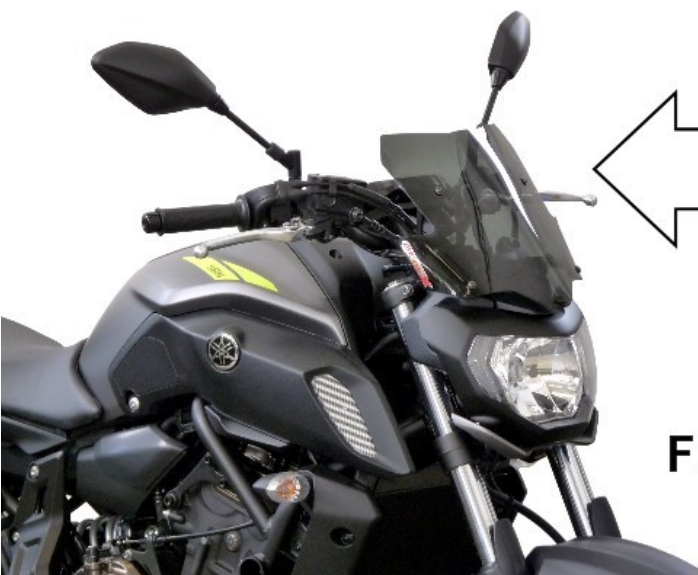
DS Fumé scuro