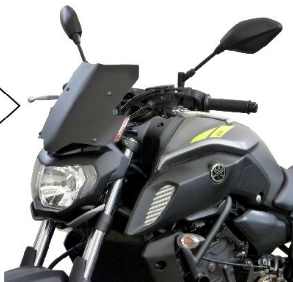
XDX nero bi satinato