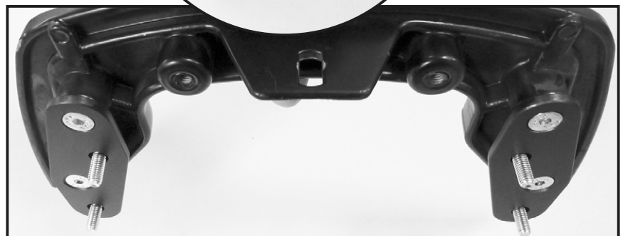
Montage bei Verlegung nach oben Mounting when installed upwards

Nun die vormontierten C-Bows samt Sechskantschrauben M6x18 mit den selbstsichernden Muttern M6 sowie U-Scheiben Ø6,4 an den C-Bow Haltern verschrauben.