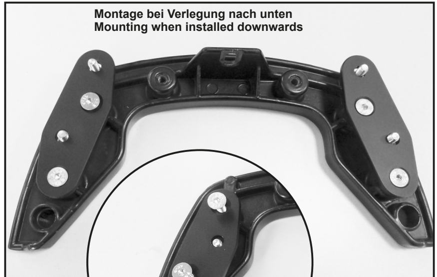
Montage bei Verlegung nach unten Mounting when installed downwards

Position the adapters on the C-Bows according to the laying direction and slightly tighten the countersunk screws M6x16. Now insert the hexagon screws M6x18 with washers Ø6,4 from the back. Now tighten the countersunk screws. Observe the sequence!